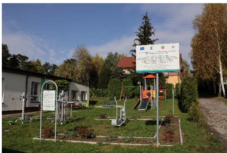
PLAC ZABAW I ZIELONA SIŁOWNIA W KAMIEŃCZYCACH