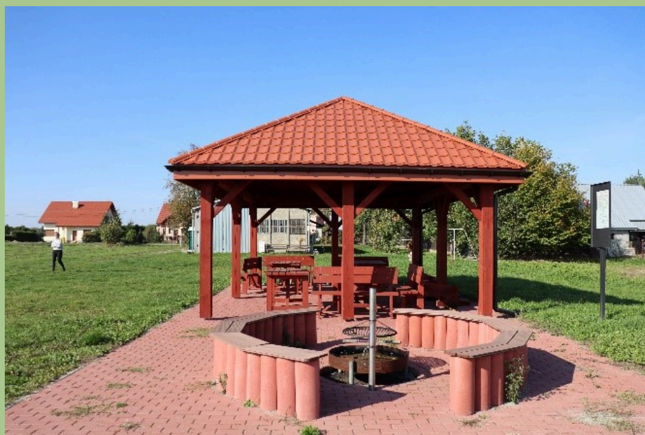
ALTANA PRZY ŁĄDOWISKU W STRZELCACH MAŁYCH